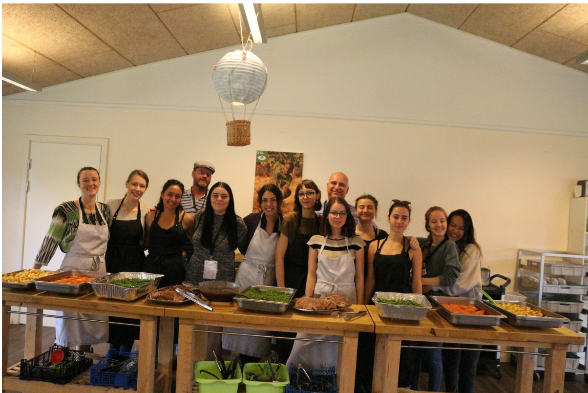
Forsyningstroppeerne Tvind DM 2019